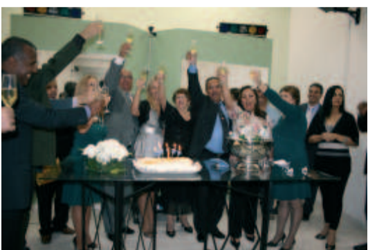
Diretores, associados e simpatizantes formam a Família Adepom

A festa foi dia 22 de agosto último na sede da entidade, sita à rua Dr. Rodrigo de Barros, 112, bairro da Luz, com a presença de várias personalidades, entre as quais o cantor Agnaldo Timóteo, o deputado Campos Machado, o subcomandante da PM, muitos amigos e diretores associados.