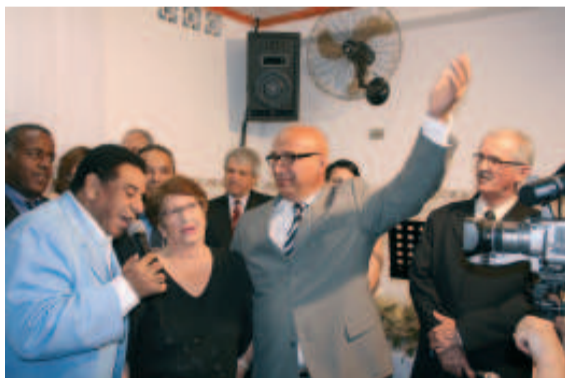
Com certeza, Agnaldo Timóteo estará mais uma vez abrilhantando o baile