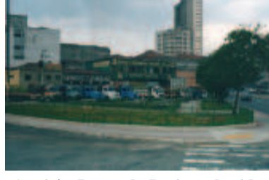
Aqui é o Largo do Pari, conhecido como a Praça do Coco